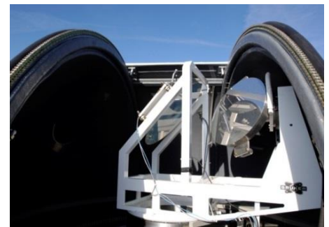
Kuppel für die optische Vertikalsondierung von Methan und Ethan

Für den Zeitraum bis zum vollständigen Umstieg auf erneuerbare Energien gilt bislang Erdgas als die klimafreundlichere Alternative zur Kohle, da bei seiner Verbrennung nur etwa halb so viel Kohlendioxid entsteht. Das hydraulische Aufbrechen von Gesteinsschichten („Fracking“) zur unkonventionellen Gewinnung von Erdgas wird daher als Brückentechnologie diskutiert.