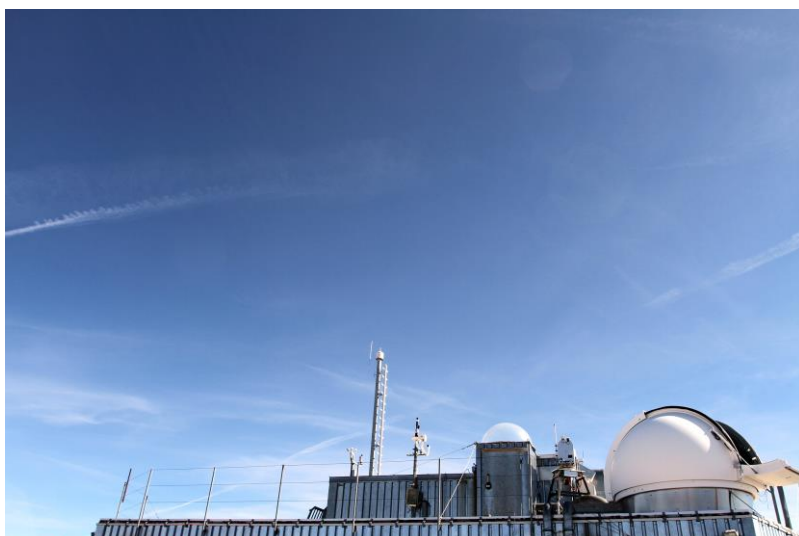
Gipfelobservatorium des KIT auf der Zugspitze mit Kuppel für die optische Vertikalsondierung von Methan und Ethan

Studie des KIT zeigt den Zusammenhang zwischen der Förderung von Öl und Erdgas in den USA und der Zunahme der Methan-Konzentration in der Atmosphäre